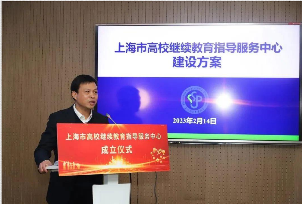
上海第二工业大学校长谢华清介绍相关情况

谢华清介绍了上海市高校继续教育指导服务中心的建设背景、发展目标、建设规划和主要任务等基本情况。中心旨在联合全市继续教育力量，围绕“建设更高水平、更高质量的学习型社会”，完善和优化高质量继续教育体系建设、提升继续教育服务能力和水平，推动继续教育更高质量发展。中心的主要职能包括协助相关部门统筹开展本市高校继续教育领域的顶层设计和研究，建立和完善本市高校非学历继续教育办学评估和质量体系，深入推进“双元制”职工继续教育的内容供给、师资培训、方法研讨和服务协调，为新时代继续教育高质量发展提供坚实的研究和管理服务平台支撑。