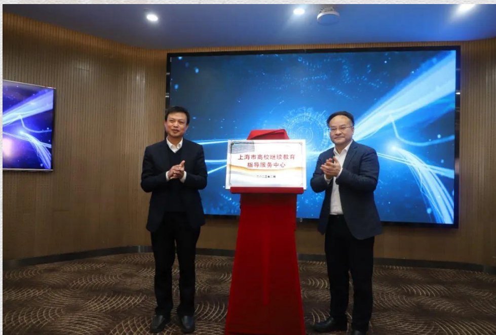
市教委副主任倪闽景、上海第二工业大学校长谢华清 为“上海市高校继续教育指导服务中心”揭牌

2月14日上午，上海市高校继续教育指导服务中心成立仪式在上海第二工业大学举行。这是本市服务学习型社会建设、推动新时代继续教育高质量发展的重要举措。上海市教委副主任倪闽景、上海第二工业大学党委书记吴松、校长谢华清和市教委终身教育处、高等教育处相关负责同志以及来自市人社局、市总工会和本市各高校的专家学者等出席。活动由上海第二工业大学副校长丁力主持。倪闽景、谢华清共同为上海市高校继续教育指导服务中心揭牌。倪闽景、吴松、谢华清为中心管理委员会和专家组成员颁发了聘书。