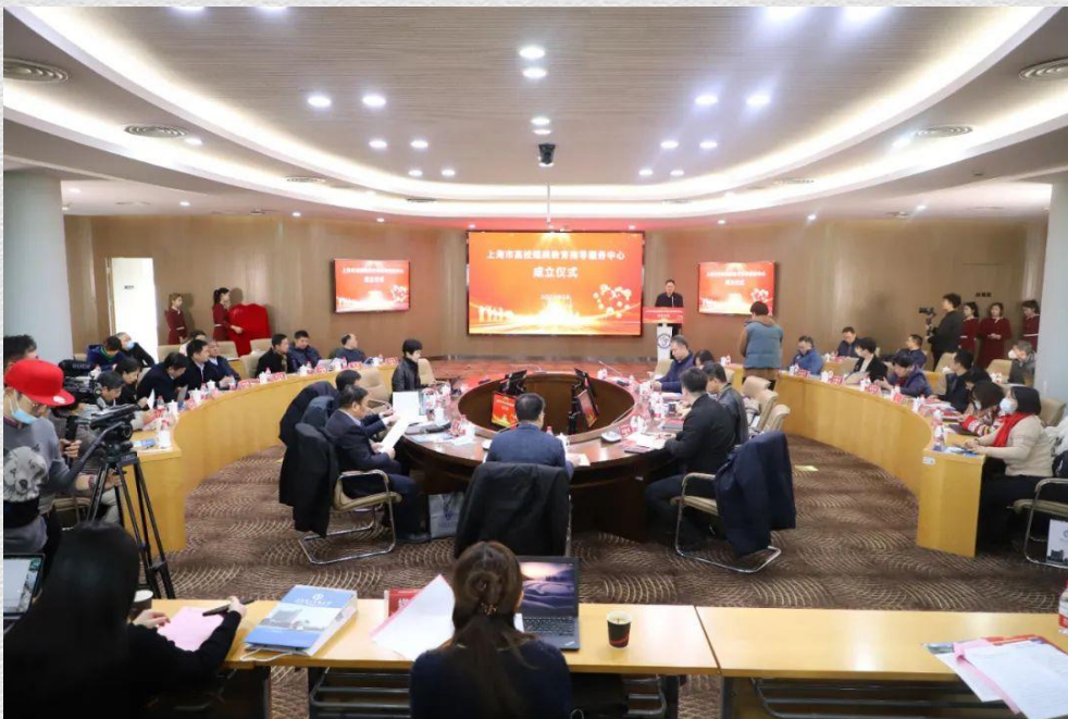
“上海市高校继续教育指导服务中心”成立大会现场