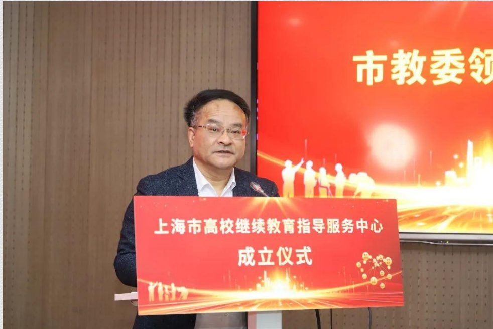
市教委副主任倪闽景讲话

党的二十大报告明确要求“推进教育数字化，建设全民终身学习的学习型社会、学习型大国”；《上海市教育发展“十四五”规划》也提出，要进一步完善服务全民的终身学习体系，率先建成以城市学习力为驱动的更高水平、更高质量的学习型社会。