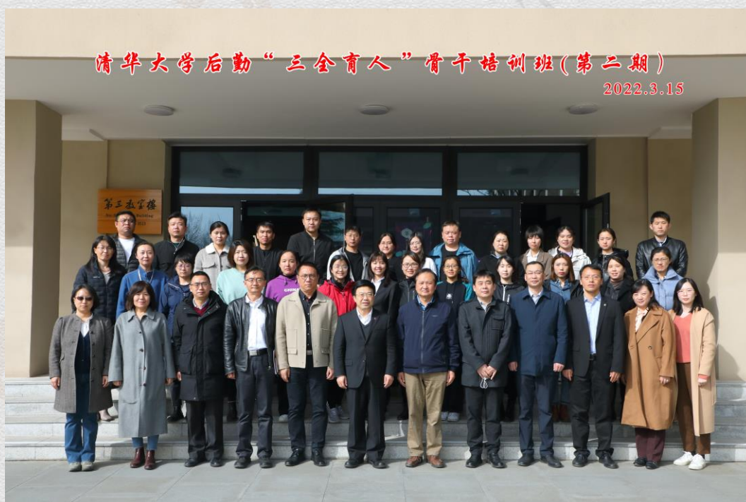
第二期培训班师生与嘉宾合影

后勤首期“三全育人”骨干培训班在 10 周 32 课时里，坚持以学习者为中心，突出自主性、经验性以及学习情境和协作模式的创设，涵盖成人学习理论、引导式课程结构、教学策略匹配、学习效果评估 4 个模块。来自后勤 6 个单位的 27 名学员分为 5 个小组，共同完成课程学习、小组研讨、应用练习等环节，用扎实的课程学习和精彩的说课演练为本期培训班画上了圆满的句号。来自总务办、