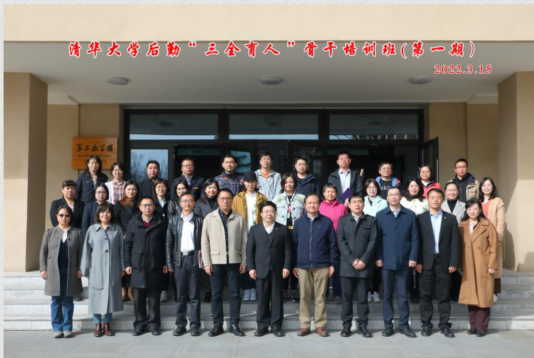
第一期培训班师生与嘉宾合影